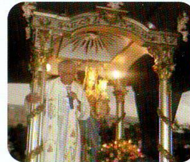
La Madonna sotto il ponte