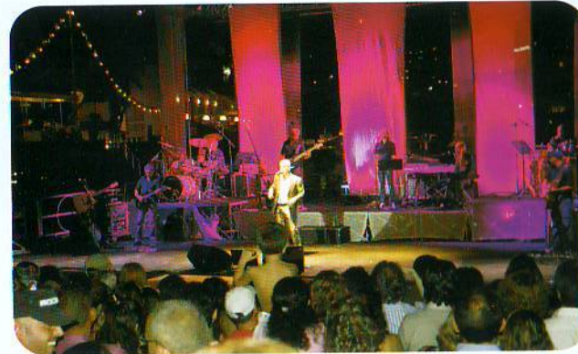
Spettacolo su palco a mare

Il Comitato ringrazia i pescatori, i commercianti e gli abitanti di Ognina, le forze dell'ordine, la Misericordia ed il Gruppo Fratres per aver contribuito alla buona organizzazione della festa.