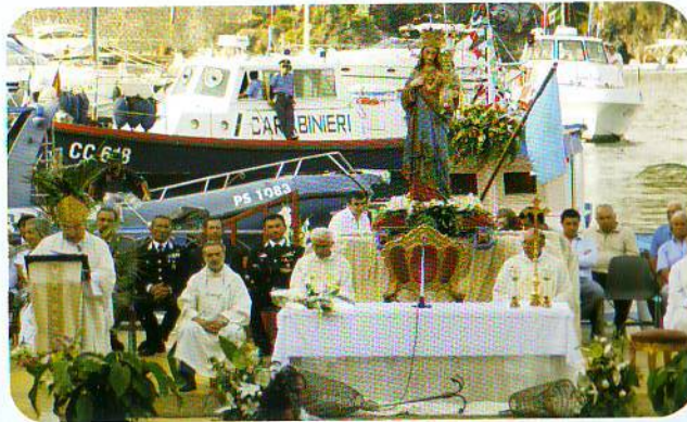
Madonna a Mare